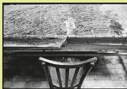
La Tinaia, Florence, Italie, 1993.

Conférence interdisciplinaire – 25.04.2018