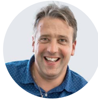
Achim Bader Projekte / Digitale Zugänglichkeitsdaten