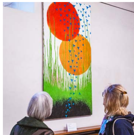
Kunsausstellung Zürich: Vernissage «Kunst ohne Hindernisse» in der Predigerkirche