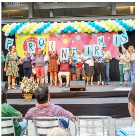
Jubiläumsschor: Auftritt des inklusiven Chors an der Jubiläumsfeier im Puls 5